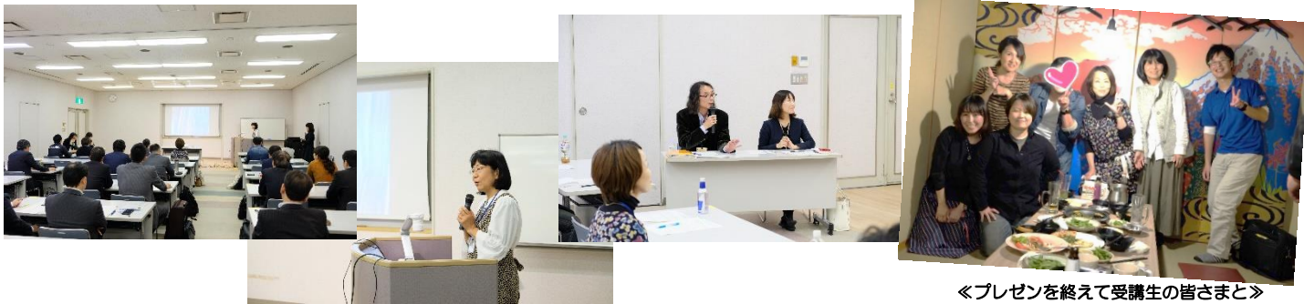
「プレゼンを終えて受講生の皆さまと」

スクール修了後は「皆さんからフィードバック、アドバイスを受けることにより、後押しされ、最後まで参加できた」「起業が実現できるのではないかと思います」「スクールに通いカリキュラムが進むにつれて、自分のプランが洗練され、意識も高めることが出来た」とお声を頂きました。今後、受講生の皆さまが起業に向かって実現させるために今後も学び、行動し続けるパワーをお一人お一人から感じています。